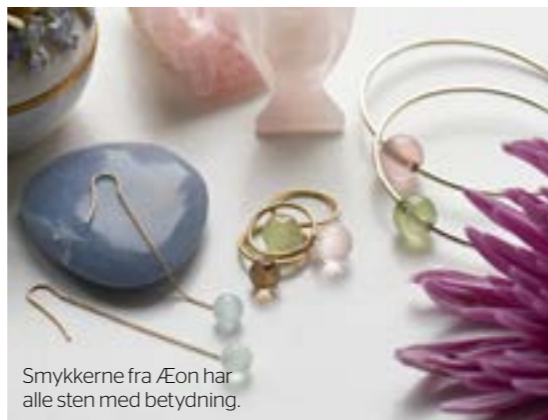
Smykkerne fra Æon har alle sten med betydning.