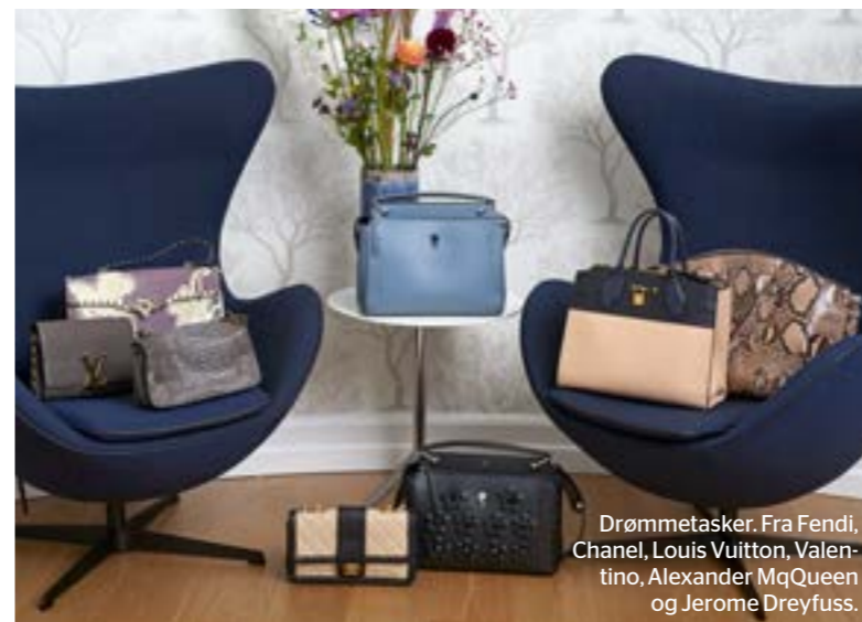
Drømmetasker. Fra Fendi, Chanel, Louis Vuitton, Valentino, Alexander McQueen og Jerome Dreyfuss.