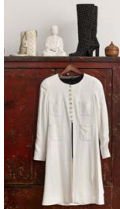
Et af Rikkens ældste og bedste køb er vintagejakken fra Chanel. Her med blondetop fra Heartmade, taske og støvler fra Chanel.

– Jeg køber gerne en pels hvert år, for da jeg var alenemor, fik mine veninder smukke gaver af deres mænd, mens jeg ikke fik nogen. Så jeg tænkte: ”Det må jeg selv sørge for” og har siden hvert år sparet sammen til en pels, enten dyr eller billigere, afhængig af, hvad der kunne lade sig gøre.