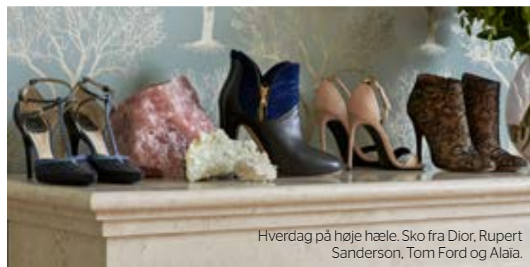
Hverdag på høje hæle. Sko fra Dior, Rupert Sanderson, Tom Ford og Alaïa.