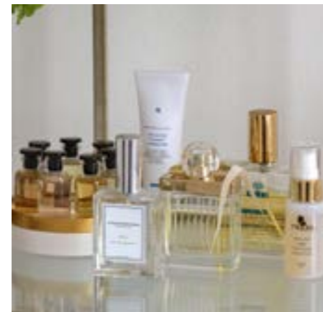
Skønne favoritter: dufte fra Louis Vuitton, Tromborg og Chloé, hudpleje fra Skin Ceuticals, Nuxe og Miqura.